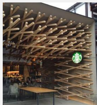
日本最美麗的星巴克之一