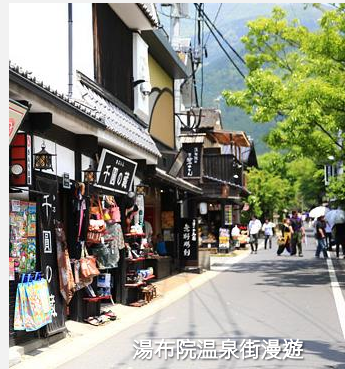
湯布院溫泉街漫遊

湯布院是九州非常有名的溫泉小鎮，跟一般的溫泉小鎮不太相同，湯布院經過悉心打造成十分具有藝術氣息的小鎮，特別受到日本 OL 女士的追捧。自由在湯布院溫泉街上漫遊，可前往 SNOOPY 茶屋、金鱗湖等等。其中湯布院 Floral Village 是以世界最美麗的村莊：英國的 Cotswold 作為藍本而興建，因此散發著濃厚的英式風格，步入村莊內有如誤闖哈利波特的世界。Floral Village 除了有幢幢英式建築，更展示了多輛英式中古汽車，除此之外，湯布院 Floral Village 亦把動畫《魔女宅急便》的場景重現，在湯布院 Floral Village 之中遊客可以到訪女主角琪琪的麵包店，粉絲必到。