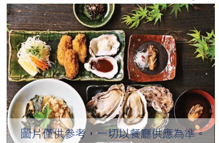
圖片僅供參考，一切以餐廳供應為準。

廣島最著名的美味以牡蠣最具代表性，產量居日本之冠，有海中牛奶美名。瀨戶內海的潔淨與浮游生物豐富，造就廣島牡蠣鮮肥飽滿，富含豐富蛋白質、脂肪等人體所需養分，尤其是罕有特別的牛磺酸，具有降低膽固醇、防止貧血等功效。且不論蒸、煮、炒、炸、帶殼烤或生食，味道都非常鮮美。特別安排牡蠣料理，一嚐當地名物，滿足味蕾享受。