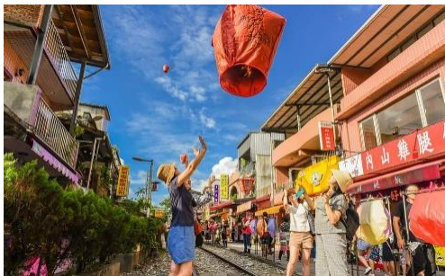
〈平溪·菁桐〉 天燈之鄉 點亮幸福天燈