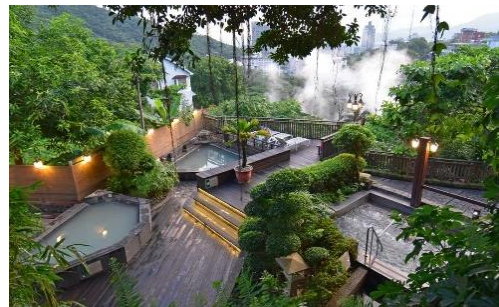
〈北投春天溫泉〉 美人湯 寧靜的露天風呂

位於西門町的打狗霸火鍋餐廳有 600 個火鍋座位、200 個日本料理座位，堪稱全台最大火鍋店。食材新鮮，除了火鍋，也提供日式料理。