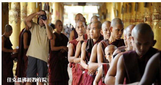
佳克溫佛經教育院

佳克溫佛經教育院每天早上都聚集千名佛徒在院內化緣，可以感受布施及當地民族化緣情景，為這趟旅程留下難忘的回憶。