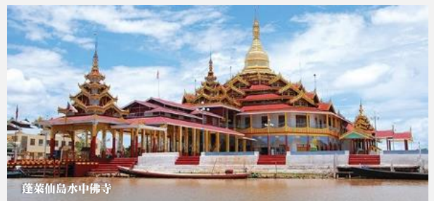
蓬萊仙島水中佛寺

建於 1952 年，翁山之弟烏奴為求世界和平而建，因為它的名字所暗示的，它是專門為實現全球和平。圍繞主佛塔的圓形平台，和平塔建有六對大門、六尊大佛，塔的正中央是一個小寶庫，供奉一尊一噸重的錫佛，左右兩旁供的是佛的兩大弟子舍利弗和目犍連的舍利子。