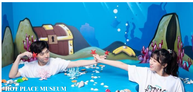
HOT PLACE MUSEUM

透過 AR 和媒體藝術，下載 Hotplace Museum 手機 APP，可以享受各種多媒體特效，讓畫面更加豐富和動感，帶給您全新的體驗。另更有著名的韓國男團/女歌手(Seven 0' Clock、Orly)曾在此拍攝 MV，令 HOT PLACE 更成為熱門打卡地。