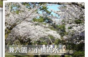
兼六園・小橋流水