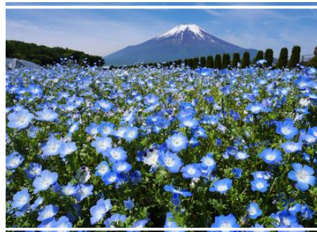
粉蝶花，賞期為五月