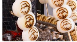
炭火現烤富士山麻糬

搭纜車前往天上山公園(KACHI-KACHI 山)的途中可以看到狸貓跟兔子一直出現，這可是有個兔子為一對老夫妻向狸貓復仇的小故事。其中聰明的兔子用石頭點火，趁狸貓不注意時丟進背籃中把狸貓背部燒傷，其中石頭碰撞點火「喀擦喀擦=KACHI-KACHI」的聲音，就是天上山公園之名的由來。