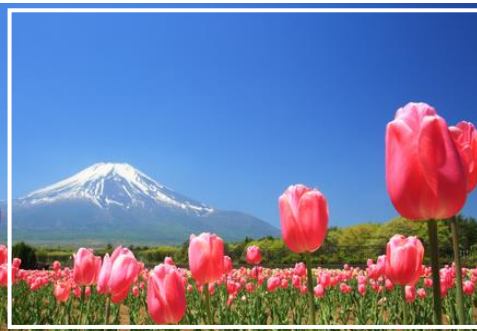
鬱金香，賞期為四月下旬至五月上旬，有約 15 萬株

花之都公園位於距離富士山最近的湖泊附近，座落在海拔 1000 公尺的高地上，佔地約為 30 萬平方米。廣闊的園內一年四季繁花盛開，繽紛浪漫。在全天候控溫的溫室環境和充足的水源供給下，全年都能欣賞到珍稀的熱帶植物和蘭花。其他還有和式庭園、三連大水車、明神瀑布、水上樂園、熔岩樹形地下體驗基地等各種遊樂設施。在富士山的背景下，欣賞花田陳鋪於眼前的廣闊美景。春天開滿鬱金香，夏天則會綻放向日葵，秋有秋櫻，最大的特色是每個季節都有不同的鮮花盛開。當冬天來臨，則會舉行燈飾，夕陽西下時太陽也正好會經過富士山頂，富士山頂端一點閃閃發光如同鑽戒一般，是觀賞「鑽石富士」的好時機。