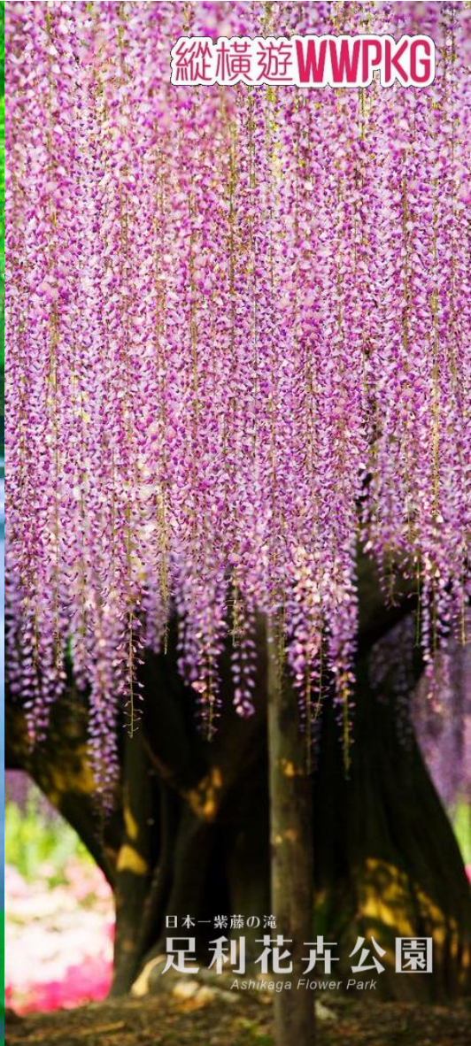
日本一紫藤の滝 足利花卉公園 Ashikaga Flower Park