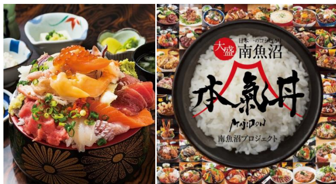
(圖片僅供參考，實際以當地為準。)

好吃的越光米上鋪上新鮮時令食材，光看外觀就令人食指大動。吃過本氣丼的客人幾乎都能感受到店老闆的真誠！