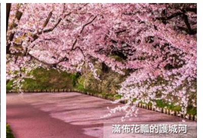
滿佈花飄的護城河