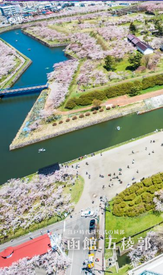
江戶時代模範式的城郭 函館五稜郭 Goryokaku