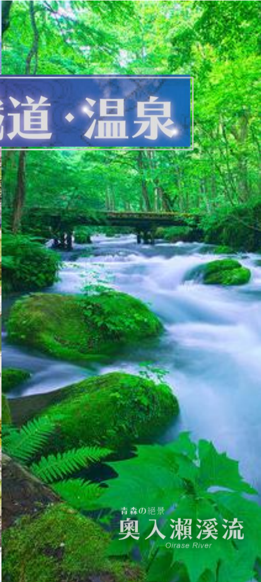
青森の絶景 奥入瀨溪流 Oirase River