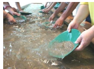
西三川黃金公園淘金體驗