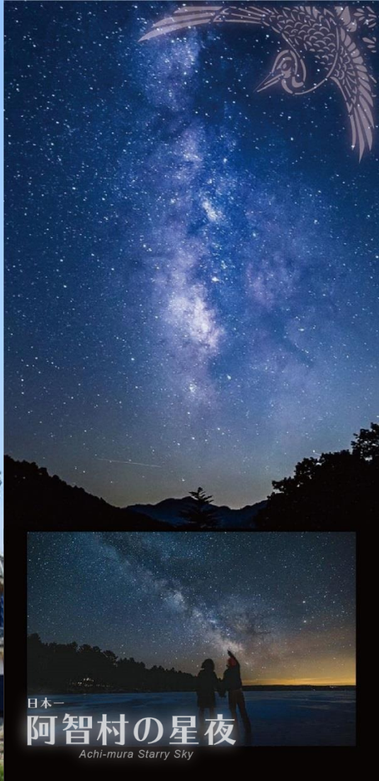
日本一 阿智村の星夜 Achi-mura Starry Sky