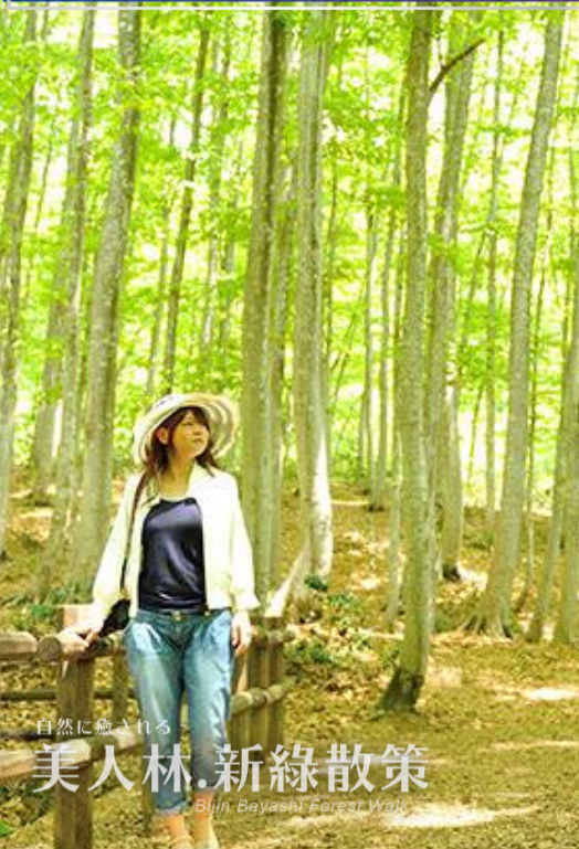
自然に癒される 美人林.新緑散策 Bijin Bayashi Forest Walk