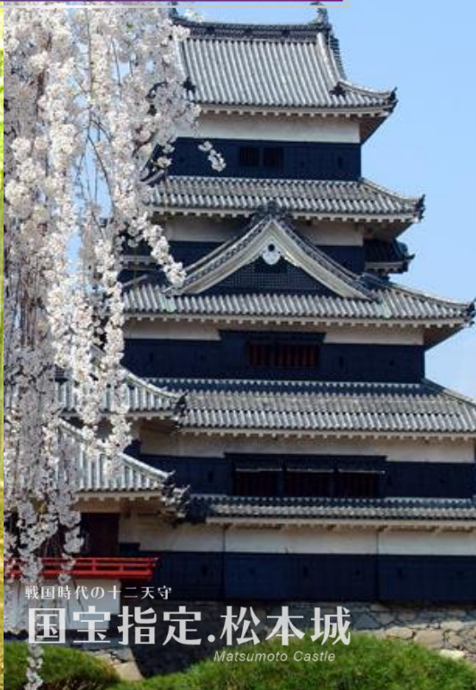
戦国時代の十二天守 国宝指定.松本城 Matsumoto Castle