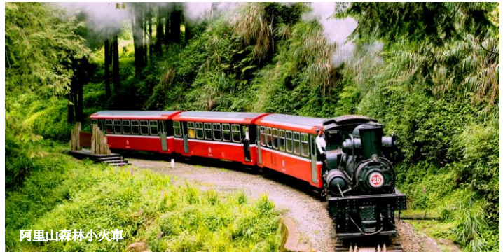
阿里山森林小火車

全長 71.4 公里，自海拔 30 米的嘉義，一路爬升至 2216 米高的阿里山。昔日為了集運木材、運輸生活物資而興建，如今已演變成觀光鐵路列車。分為平地與山地兩個線段，前者指嘉義至竹崎，後者為竹崎至阿里山。搭乘阿里山森林小火車可欣賞各種天然美景，包括日出、雲海、晚霞、神木或是季節限定的櫻花。