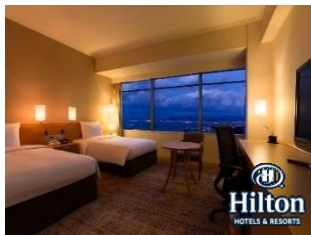
Hilton HOTELS & RESORTS