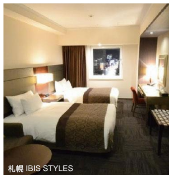
札幌 IBIS STYLES