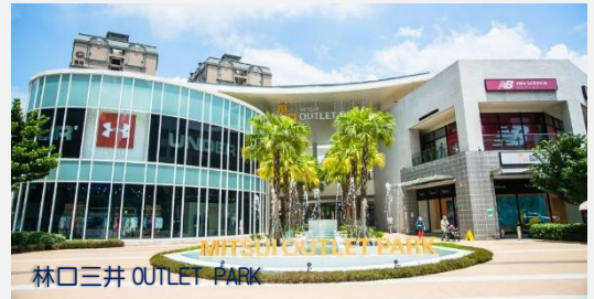
林口三井 OUTLET PARK

購物中心內不只提供高品質的折扣精品，包括男女裝、生活用品、童裝、手錶飾品等，同時有書店、超市、電影院、遊戲娛樂等區域規劃，並在美食區引進多家日本排隊名店，一次滿足您購物、休閒與美食的需求。