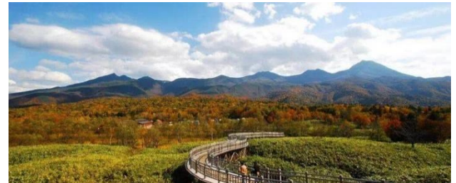
知床五湖高架木道 及 知床五湖展望台

知床是有名的瀑布王國，在知床斜里町觀光協會推薦的知床八景中，就有 3 景是瀑布。其中「澳新考新瀑布」更是日本瀑布百選，落差達 80 米，從正面觀賞到水流的震撼之美。