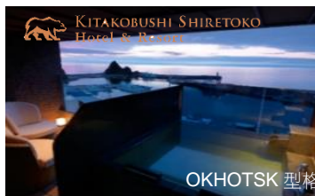
OKHOTSK 型格海邊私人露天溫泉房間