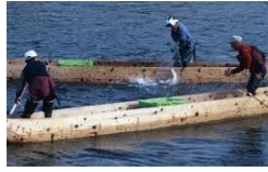
傳統技術捕捉三文魚場景