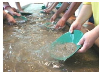
西三川黃金公園淘金體驗