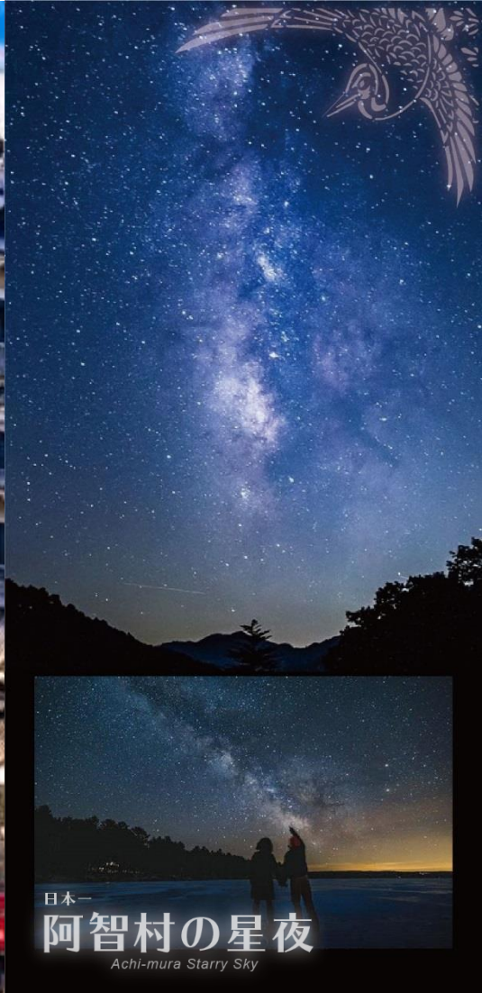
日本一 阿智村の星夜 Achi-mura Starry Sky