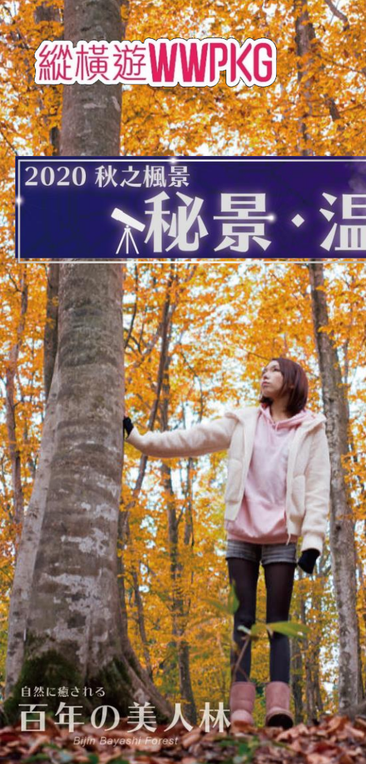
自然に癒される 百年の美人林 Bijin Bayashi Forest