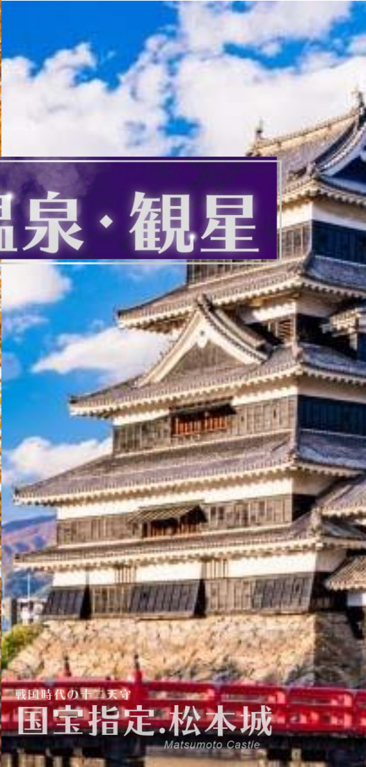
戦国時代の十二天守 国宝指定・松本城 Matsumoto Castle