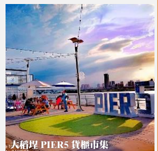
大稻埕 PIER5 貨櫃市集