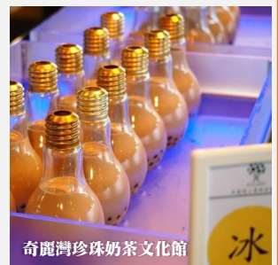
奇麗灣珍珠奶茶文化館