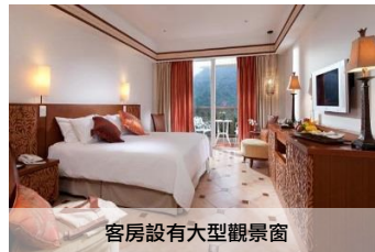
客房設有大型觀景窗

心采風呂 由懷舊的馬賽克磁磚鋪陳出的日式溫泉浴場，分別有四種不同水溫的水池，以及打滌浴及烤箱。