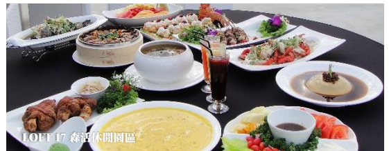
LOFT 17 森活休閒園區