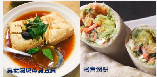
臭老闆現蒸臭豆腐