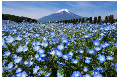
粉蝶花，賞期為五月