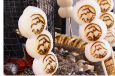
炭火現烤富士山麻糬

搭纜車前往天上山公園(KACHI-KACHI 山)的途中可以看到狸貓跟兔子一直出現，這可是有個兔子為一對老夫妻向狸貓復仇的小故事。其中聰明的兔子用石頭點火，趁狸貓不注意時丟進背籃中把狸貓背部燒傷，其中石頭碰撞點火『喀擦喀擦=KACHI-KACHI』的聲音，就是天上山公園之名的由來。