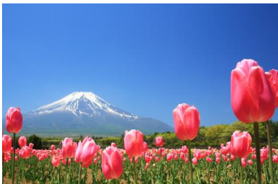
鬱金香，賞期為四月下旬至五月上旬，有約 15 萬株

花之都公園位於距離富士山最近的湖泊附近，座落在海拔 1000 公尺的高地上，佔地約為 30 萬平方米。廣闊的園內一年四季繁花盛開，繽紛浪漫。在全天候控溫的溫室環境和充足的水源供給下，全年都能欣賞到珍稀的熱帶植物和蘭花。其他還有和式庭園、三連大水車、明神瀑布、水上樂園、熔岩樹形地下體驗基地等各種遊樂設施。在富士山的背景下，欣賞花田陳鋪於眼前的廣闊美景。春天開滿鬱金香，夏天則會綻放向日葵，秋有秋櫻，最大的特色是每個季節都有不同的鮮花盛開。當冬天來臨，則會舉行燈飾，夕陽西下時太陽也正好會經過富士山頂，富士山頂端一點閃閃發光如同鑽石一般，是觀賞「鑽石富士」的好時機。