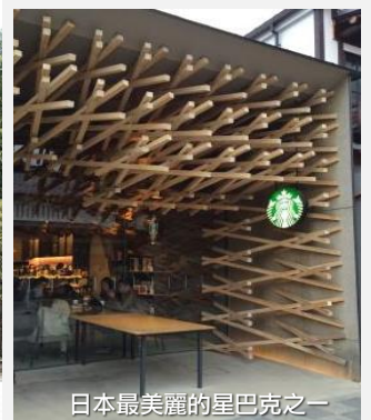
日本最美麗的星巴克之一