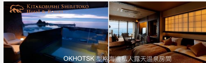
OKHOTSK 型格海邊私人露天溫泉房間