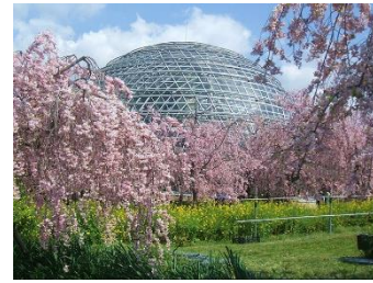
即日起至4月19日期間出發增遊

東谷山水果公園是位於愛知縣名古屋市守山區東谷山麓的公園設施，在大小兩座圓頂造型的世界熱帶果樹溫室中，可以看到香蕉、木瓜、椰子、荔枝、波羅蜜等104個品種、共282棵熱帶果樹與亞熱帶果樹。櫻花時節更會有1000株以垂櫻為主的櫻花樹盛放，吸引當地人以及遊客前往觀賞。