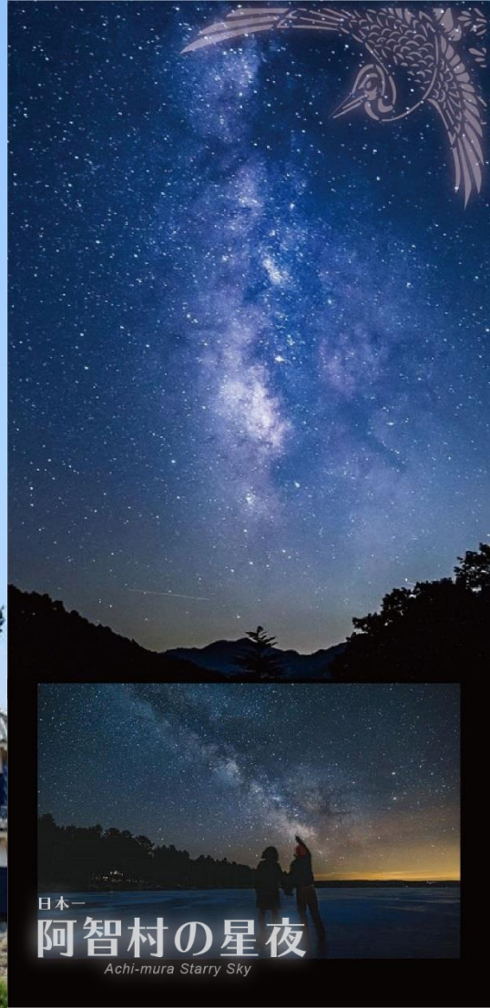
日本一 阿智村の星夜 Achi-mura Starry Sky