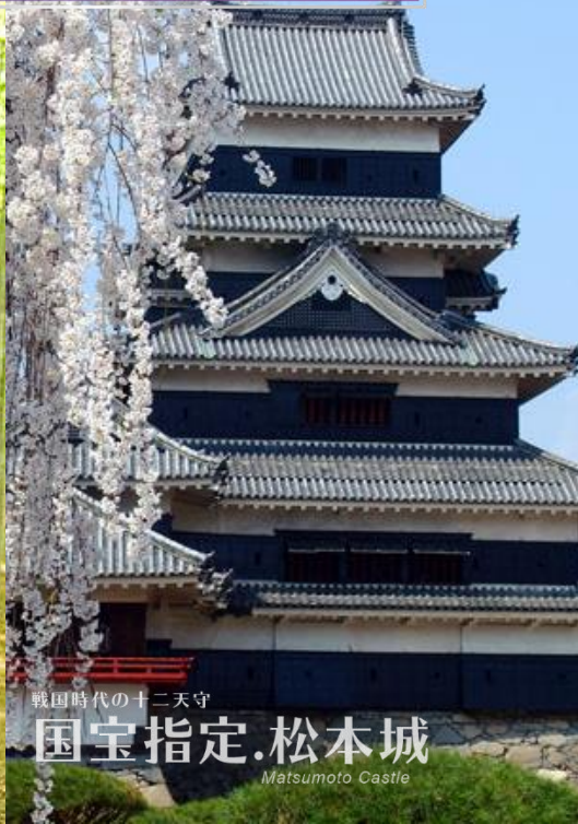
戦国時代の十二天守 国宝指定.松本城 Matsumoto Castle