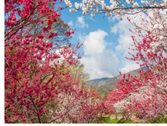
4月14日至5月5日期間出發增遊

長約4km的村內國道256號沿線周邊就有多達1萬株嘅花桃樹，被譽為「日本第一的桃源鄉」。分成紅色、白色、粉色，共三色盛開綻放的「三色花桃」展現着多樣的層次為其一大魅力。開花期間會舉辦「花桃祭」，吸引許到觀光客前來造訪欣賞。花桃祭期間可以買到各種縣信州流傳特產。