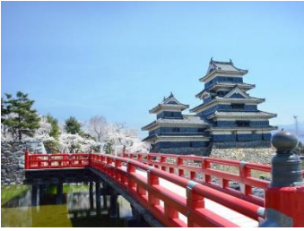
4月上旬至中旬賞櫻

松本市的象徵「松本城」，約400年前築成的名城，是目前日本現存的最古老的五重六層式的國寶之城。與姬路城、彥根城、太山城同稱為日本4大國寶級城堡。於松本城公園可眺望壯觀天守閣及太鼓門、二の丸御殿跡。另亦可自行購票參觀本丸庭園及天守閣(約600日圓)。松本城擁有約300棵染井吉野與八重櫻可供觀賞。