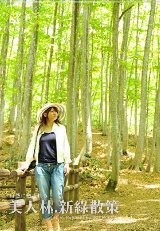
自然に癒される 美人林.新緑散策 Bijin Bayashi Forest Walk