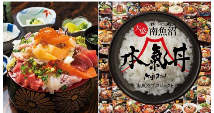
(圖片僅供參考，實際以當地為準。)

好吃的越光米上鋪上新鮮時令食材，光看外觀就令人食指大動。吃過本氣丼的客人幾乎都能感受到店老闆的真誠！