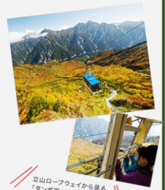
立山ロープウェイから見る「タンボ平の紅葉」は圧巻！