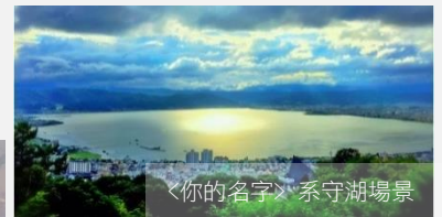
《你的名字》系守湖場景