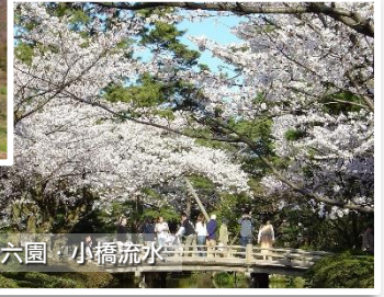
兼六園・小橋流水