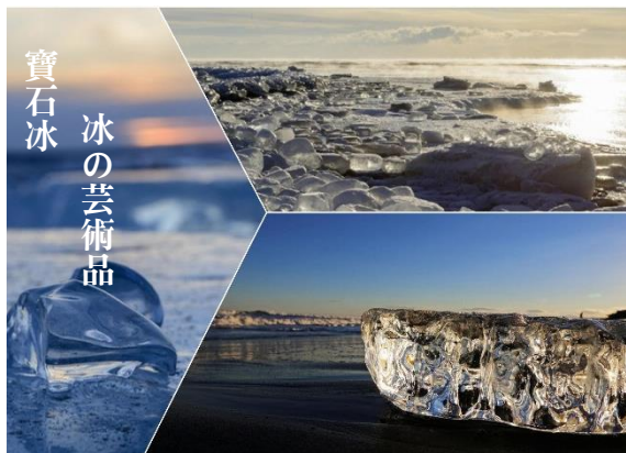
寶石冰 冰の芸術品