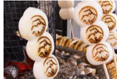
炭火現烤富士山麻糬

搭纜車前往天上山公園(KACHI-KACHI 山)的途中可以看到狸貓跟兔子一直出現，這可是有個兔子為一對老夫妻向狸貓復仇的小故事。其中聰明的兔子用石頭點火，趁狸貓不注意時丟進背籃中把狸貓背部燒傷，其中石頭碰撞點火『喀擦喀擦=KACHI-KACHI』的聲音，就是天上山公園之名的由來。