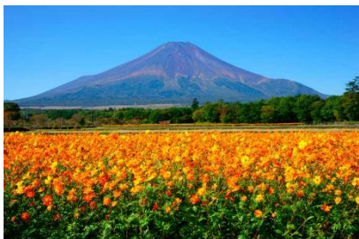
花菱草，賞期為六月中旬至下旬，有約 7 萬株

花之都公園位於距離富士山最近的湖泊附近，座落在海拔 1000 公尺的高地上，佔地約為 30 萬平方米。廣闊的園內一年四季繁花盛開，繽紛浪漫。在全天候控溫的溫室環境和充足的水源供給下，全年都能欣賞到珍稀的熱帶植物和蘭花。其他還有和式庭園、三連大水車、明神瀑布、水上樂園、熔岩樹形地下體驗基地等各種遊樂設施。在富士山的背景下，欣賞花田陳鋪於眼前的廣闊美景。春天開滿鬱金香，夏天則會綻放向日葵，秋有秋櫻，最大的特色是每個季節都有不同的鮮花盛開。6 月中旬至下旬更可欣賞到 150 萬株的黃色木辛花、17 萬株矢車菊以及 25 萬株的海縷絲花，下旬則可欣賞到 7 萬株花菱草以及 30 萬株罌粟花。當冬天來臨，則會舉行燈飾，夕陽西下時太陽也正好會經過富士山頂，富士山頂端一點閃閃發光如同鑽石一般，是觀賞「鑽石富士」的好時機。