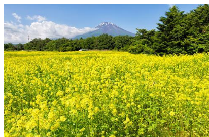
木辛花，賞期為六月中旬至下旬，有約 150 萬株