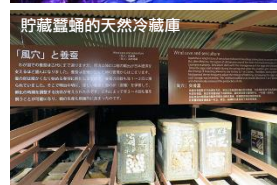
貯藏蠶蛹的天然冷藏庫