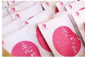
- 戀來井戸 -

可以在廣場裡的小箱購買空樽(約200円),裝下旁邊一直湧出的源泉100%的美肌溫泉水,帶回家作爽膚水使用。※保質期為5天