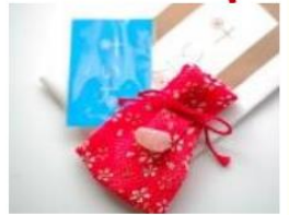
- 玉作湯神社 -

內有許願石,只要手摸它許願,有機會夢想成真。若把神社的願望成真石(約600円)與許願石相碰後許願,更將許願石的力量帶回家。