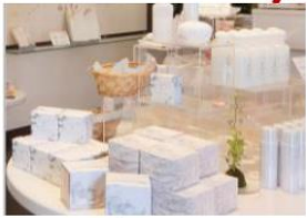
- 姫 LABO -