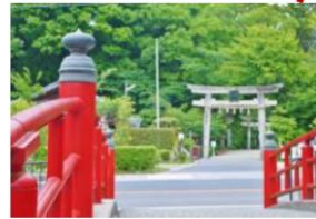
- 宮橋 -

日文中鯉魚與戀愛同音。傳說把魚糧(約100円)投進井旁的河溪,如果有鯉魚出現,代表戀愛能夠成真。