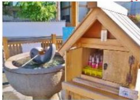
- 湯藥師廣場 -

可以在廣場裡的小箱購買空樽(約200円),裝下旁邊一直湧出的源泉100%的美肌溫泉水,帶回家作爽膚水使用。※保質期為5天