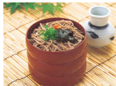
出雲名物三層蕎麥麵