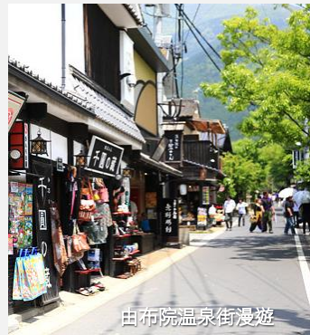
由布院溫泉街漫遊

由布院是九州非常有名的溫泉小鎮，跟一般的溫泉小鎮不太相同，湯布院經過悉心打造成十分具有藝術氣息的小鎮，特別受到日本 OL 女士的追捧。自由在由布院溫泉街上漫遊，可前往 SNOOPY 茶屋、金鱗湖等等。其中由布院 Floral Village 是以世界最美麗的村莊：英國的 Cotswold 作為藍本而興建，因此散發著濃厚的英式風格，步入村莊內有如誤闖哈利波特的世界。Floral Village 除了有多幢英式建築，更展示了多輛英式中古汽車，除此之外，由布院 Floral Village 亦把動畫《魔女宅急便》的場景重現，在由布院 Floral Village 之中遊客可以到訪女主角琪琪的麵包店，粉絲必到。