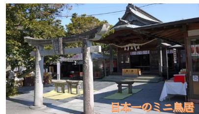
日本一のミニ鳥居

粟嶋神社位於宇土市，境內有 3 座高度約 30CM 的石造鳥居，據說只要爬過去便可以祈求無病痛災難、求子、安產、好姻緣等。不妨也來試試爬過號稱日本最小的鳥居吧？