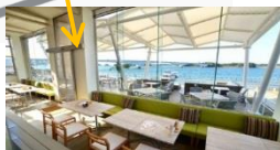
Plate cafe L'isola