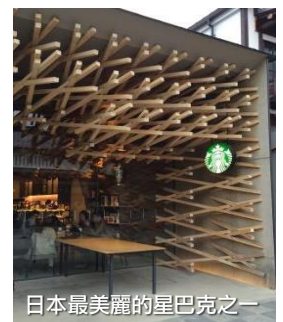
日本最美麗的星巴克之一