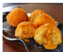
天草海食まるけん

酥鬆軟的可樂餅外皮，包裹著軟綿的海膽餡，像海膽泥的口感，混合店家特製的白醬，吃的出淡淡的海膽味，若很愛海膽的朋友可選濃厚版本！