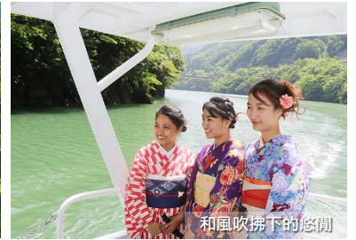
和風吹拂下的悠閒