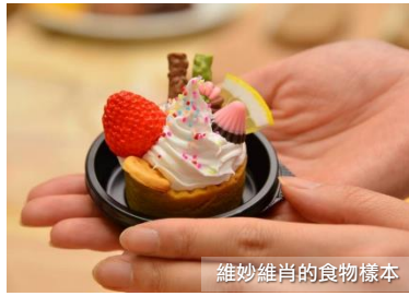
維妙維肖的食物樣本

相信大家有見過日式餐廳的櫥窗放了幾可亂真的食物樣本，賣相吸引，令人食指大動。這些維妙維肖的食物樣本其實是用熱蠟或樹膠製作，經專業人士用巧妙的手工製成。如今日本大多數的食物樣本仍然出自郡上八幡的食物樣本公司的手筆，可謂專業至極。在食物樣本工房內除了可欣賞到不同的食物樣本外， 我們還特意為您安排可以親手製作一份屬於自己的食物樣本！