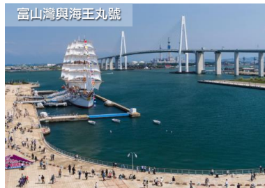
富山灣與海王丸號