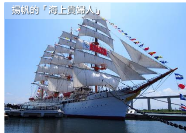
揚帆的「海上貴婦人」