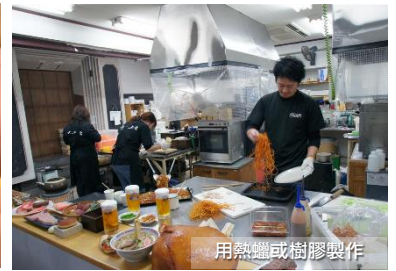
用熱蠟或樹膠製作