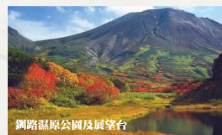
釧路濕原公園及展望台

釧路濕原位於北海道東部的釧路市北面，是日本第一個在拉姆薩爾條約(有關水禽生息地的國際條約)上登記的濕地。總面積 183 平方公里，相等於兩個香港島之大，十分遼闊。周圍的丘陵上設立了展望台，是放眼濕原四周的絕佳之處，近可俯看蜿蜒的釧路川，遠可眺望阿寒的群峰，賞楓期間從展望台可清楚觀賞釧路濕原被渲染成一片金黃色。