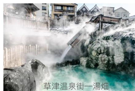
草津溫泉街一湯畑