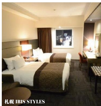
札幌 IBIS STYLES

房間約 330 呎，房內可免費使用 WIFI。2 分鐘就可到附近著名的薄野區，地理位置優越。 www.ibis.com/ja/japan/index.shtml