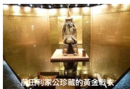
前田利家公珍藏的黃金戰衣