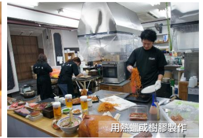
用熱蠟或樹膠製作