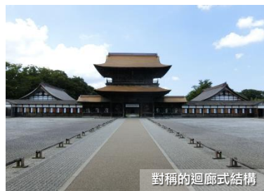
對稱的迴廊式結構

瑞龍寺全寺以伽藍布局，建築氣派典雅，其建築風格源自於中國的禪宗伽藍七堂式建築，伽藍則是寺院、道場的通稱，伽藍七堂對應着人體的各個部位，而山門、佛殿、法堂為一直線，建造出左右對稱的迴廊式結構，更被指定為日本國寶。瑞龍寺更以為人們淨化不潔的「廁所之神」而聞名，這位神為人們淨化不潔的地方，自古以來就被供奉在廁所，因此瑞龍寺也將其安置於原先是廁所的法堂內。