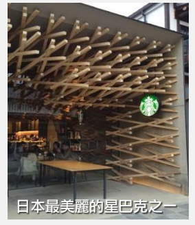
日本最美麗的星巴克之一