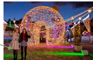
高 7m 的光之球隧道

關西第一次展出，來自法國藝術家 Antonin Fourneau 的作品。能以噴霧、水槍、海綿、筆等含水份的物件，於數千個 LED 火燈泡聚集而成的畫板上繪上不同的文字與畫作，畫板將根據水的濺射而發出有如星空一樣的光