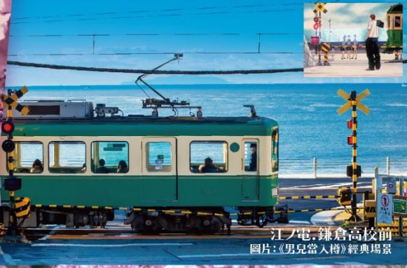
江ノ電・鎌倉高校前 圖片:《男兒當入樽》經典場景