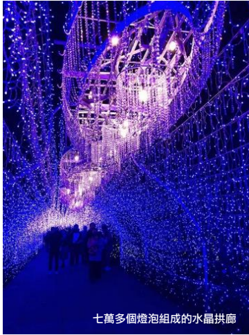
七萬多個燈泡組成的水晶拱廊