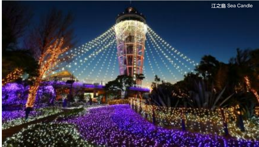
江之島 Sea Candle

「湘南之寶石」是關東三大點燈活動之一，2013年更被列入「日本的夜景遺產」。這個每年冬季鎌倉江之島地區的代表性活動將在今年迎來了第20次的舉辦。