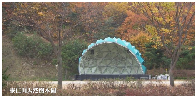
靈仁山天然樹木園

位於忠清南道的靈仁山天然樹木園，自 1997 年正式對外開放，是一個提供給大家的休養林。在靈仁山腳下，有森林林間散步小路，可以放鬆心情與大自然連為一體。附近沒有高山遮擋，因此風景景色一目了然，在 11 月中旬更可散步憩息和欣賞楓葉，享受森林植群所散發出來之氣味，以強健身心與增強活力地洗滌身心。