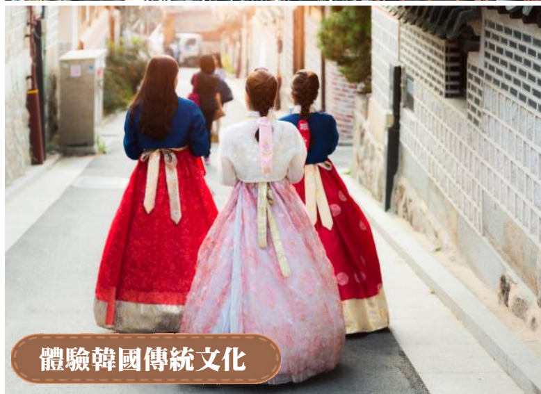
體驗韓國傳統文化