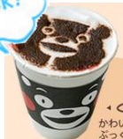
KUMAMON 咖啡 (465 日圓)