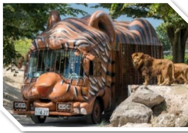
造型獨特的森林巴士