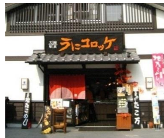
(吉列海膽餅的店舖:天草海食まるけん)