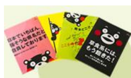
KUMAMON FILE (260 日圓)