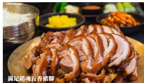
滿足銷魂五香豬腳