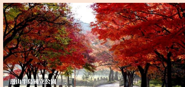
邊山半島國立公園