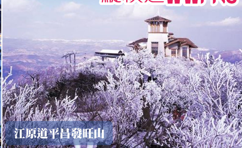
江原道平昌發旺山