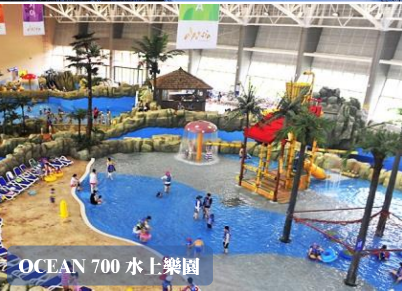
OCEAN 700 水上樂園