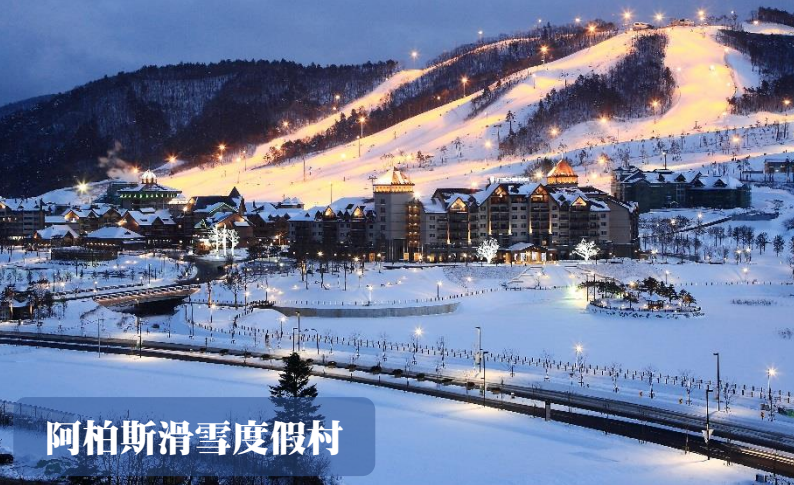
阿柏斯滑雪度假村