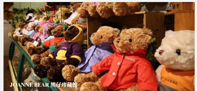
JOANNE BEAR 熊仔珍藏館

韓國超人氣的綠茶醬便是出自這個品牌，博物館展示各種綠茶產品及護膚品，又是購物的好時機！另外，亦可在咖啡室內品嚐美味的綠茶甜品！館外一大片遼闊的綠茶田，是打卡拍照的好地方。