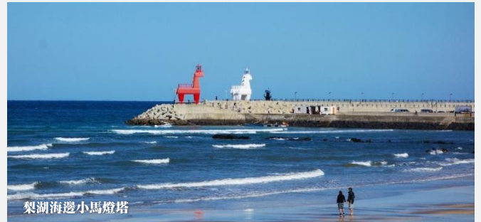
梨湖海邊小馬燈塔

濟州市區最接近大海的海水浴場，最吸引眾人注意的是其有兩座可愛馬兒造型的燈塔，一紅一白屹立在海濱上，非常吸睛，無論是遠拍或是近距離攝影，每個角度都趣味滿分！