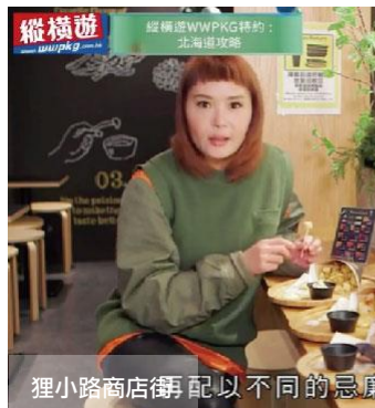
狸小路商店街 配以不同的忌廉