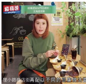
狸小路商店街再配以不同的忌廉做沾醬