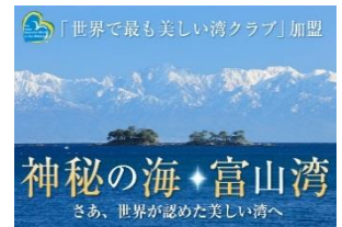
最美麗海灣・富山灣

富山灣經聯合國教科文組織下的「世界最美麗海灣組織正式審定通過登錄為「世界最美麗海灣」之一（全球有 38 個，富山灣為日本第二個）。特地安排前往海王丸公園，伴隨著高 46 米的巨型帆船海王丸號一起眺望這個最美麗海灣的景色，如天氣晴朗，更能欣賞立山黑部連峰的絕景！