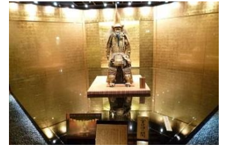
前田利家公珍藏的黃金戰衣

您知道嗎？如今日本 99% 的金箔都來自於金澤，今次帶大家去箔巧館了解金澤名產的金箔。箔巧館是以「金澤金箔」為主題的設施，剛剛翻新完畢，在此可以參觀金澤金箔的歷史、文化、製作工程，甚至能欣賞到古人前田利家公珍藏的黃金戰衣！此外也展示販賣金箔的工藝品、化妝品與食品等等，更可自行參加各式各樣金箔的體驗！